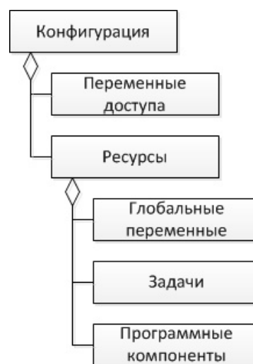
Рис. 2. Структура программной конфигурации по стандарту МЭК 61131

На драйвер ввода посредством клавиатуры, мыши, сенсорного экрана или других устройств поступают команды от пользователей. Задача драйвера заключается в преобразовании